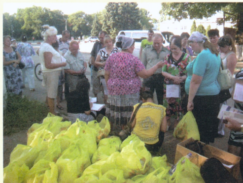
Гуманитарная помощь в Донетске