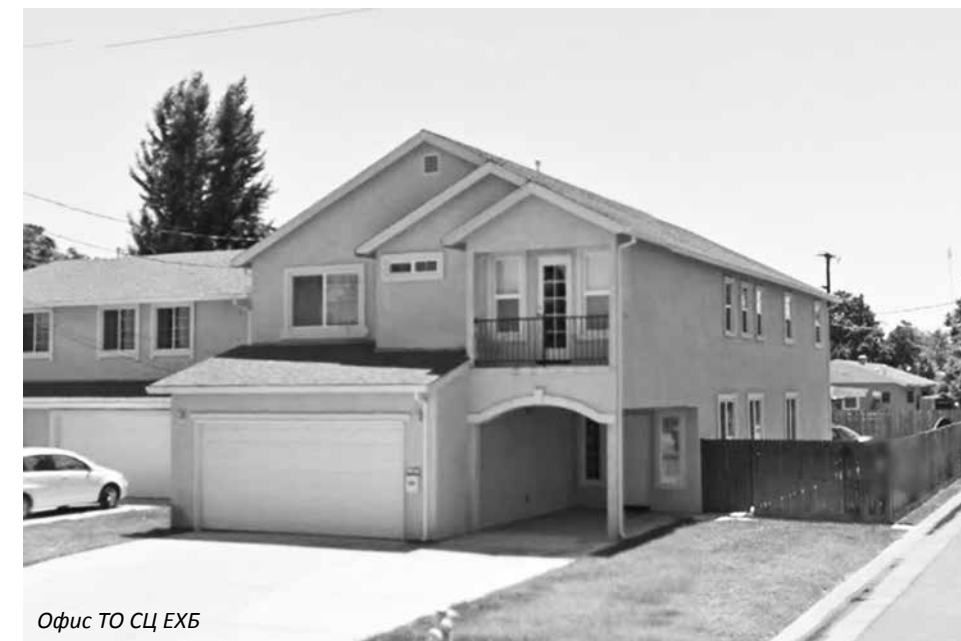
Офис ТО СЦ ЕХБ

Если вас интересуют подробности по имуществу объединения, пожалуйста, обращайтесь ко мне.