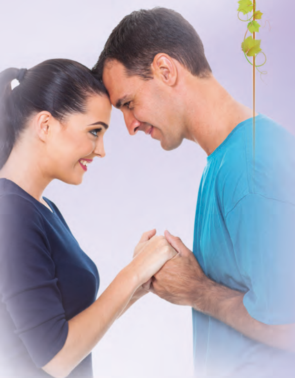
Иллюстрация из реальной жизни. Четыре молодые супружеские христианские пары. Все жены беременны. Все мужья помогают им во всем. Вопреки национальным и моральным традициям. Этим молодым мужьям-христианам их друзья и родственники-нехристиане (мужчины) говорят: «Вы чего это удумали?» А мужья-христиане просто любят своих жен и обращаются с ними, как Слово Божье говорит, а именно: как с немощнейшими сосудами. Но такие чудные взаимоотношения начались с того, что немощнейшие сосуды не умничают много, не претендуют на командирство — они не лидеры, а просто женщины, просто жены, просто хозяйки.

Не знаю, кто как, но лично я не хочу быть лидером — хочу быть женщиной, потому что Бог создал меня женщиной и дал мне задание — помогать мужу своему.