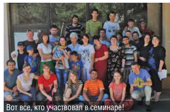
Вот все, кто участвовал в семинаре!

Вместе с Ассоциацией ХМЛ, с которыми мы начали сотрудничать еще в прошлом году, мы провели подготовку к лагерям. Команда с Украины поделилась с нами новыми идеями, программой, ресурсами, по которым многие лагерные работники уже проводили этим летом лагеря. В семинаре участвовало около двадцати пяти детских и молодежных служителей, кто задействован в лагерном служении. Это было хорошее время для обучения разным направлениям, а именно: наставничество, руководство, лидерство, спорт, рукоделие, театральное и музыкальное служение.