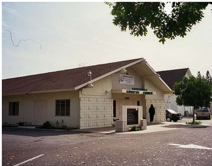
Greenville Country Church

В виду того, что в конце 1976 года, руководство Broadway Baptist Church решили продать своё помещение, пришлось искать другой рент.