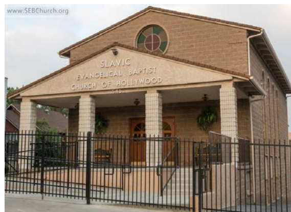
Славянская Е. Б. Церковь в Голливуде