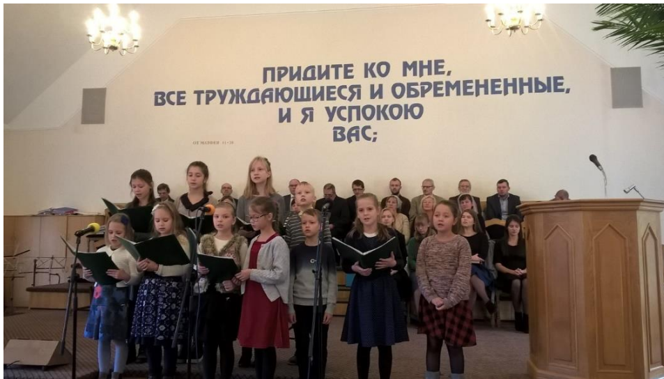
Участие в служении детей.