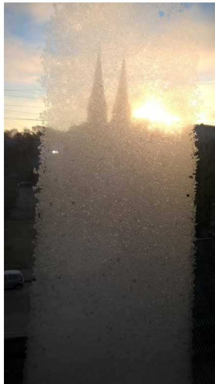
Утренние морозные узоры на стекле окна нашей комнаты.