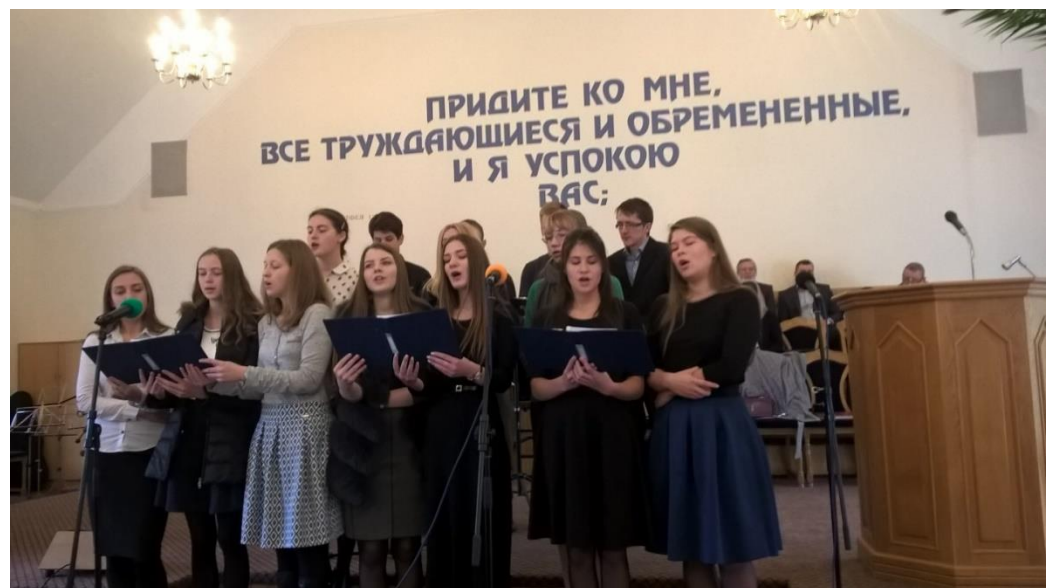
Молодежь участвует в служении пением.

После окончания служения мы имели возможность пообщаться с теми немногими членами церкви, которые были в этой церкви в те далекие советские времена. Один из них,