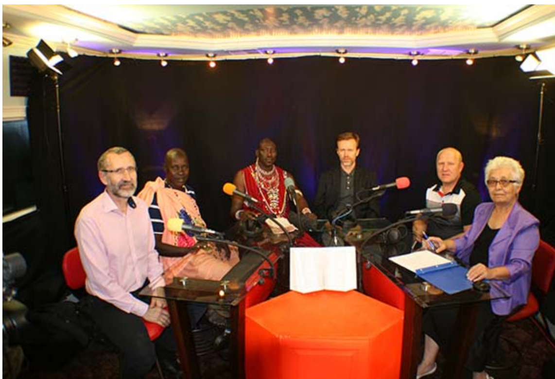
В студии Первой славянской церкви