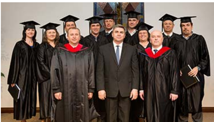
Выпускники и преподаватели

знания. Но вот позади четыре года труда, и 30 апреля 2017 года девять выпускников института получили дипломы "Бакалавр церковного служения". Более подробно об этом событии читайте на вебсайте Объединения .