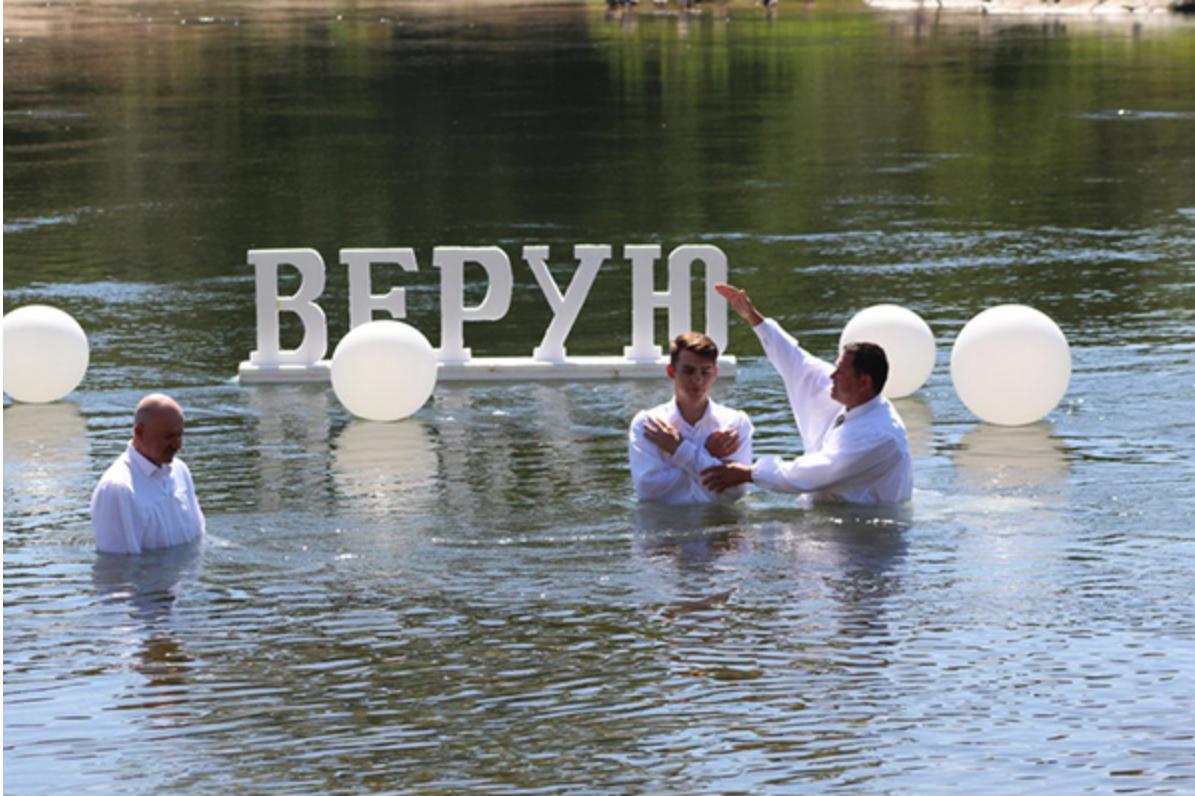
Крещение в American River