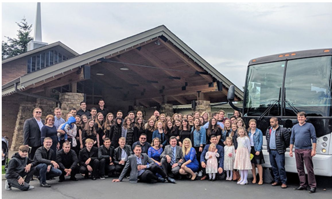
Молодежь двух церквей

«Мы, многие, составляем одно тело во Христе» (Римлянам 12: 5а), одну церковь. Церковь не ограничена географией; для нее нет границ и ей не препятствуют огромные расстояния. Именно к такому выводу пришла молодежь двух церквей: церкви "Благая весть", Такома и Второй славянской баптистской церкви Сакраменто. И о том, что именно их подвигло к такому заключению, читайте статью на вебсайте Объединения .