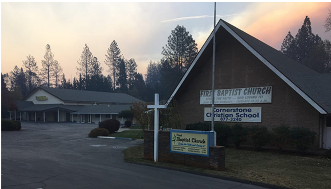
Чудом уцелевшее здание церкви

В своей статье, опубликованной на вебсайте Объединения, он рассказывает о служителях Божьих, которые, потеряв все во время служения, продолжают дело Божье. Читайте статью К. Ткаченко здесь .