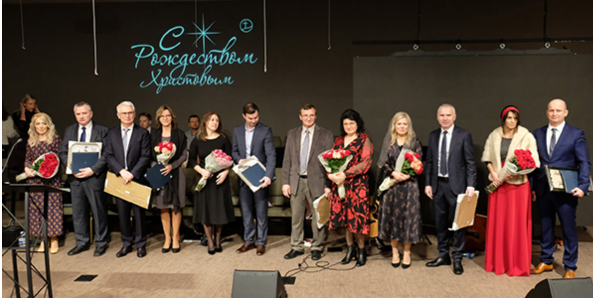
Новые служители с женами