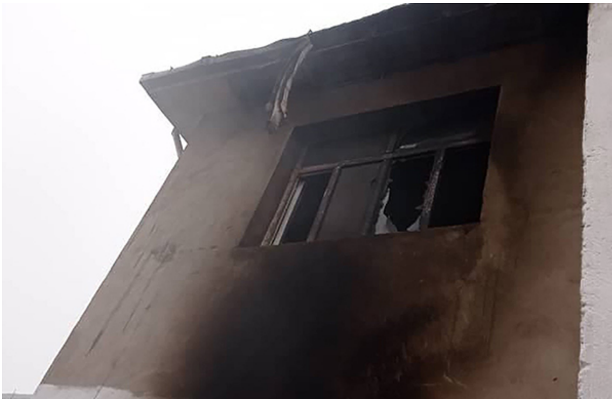
Так теперь выглядит Центр надежды

Миссия просит по возможности откликнуться на эту беду своими пожертвованиями. Адрес для отправки пожертвований указан в той же статье – кликните эту ссылку .