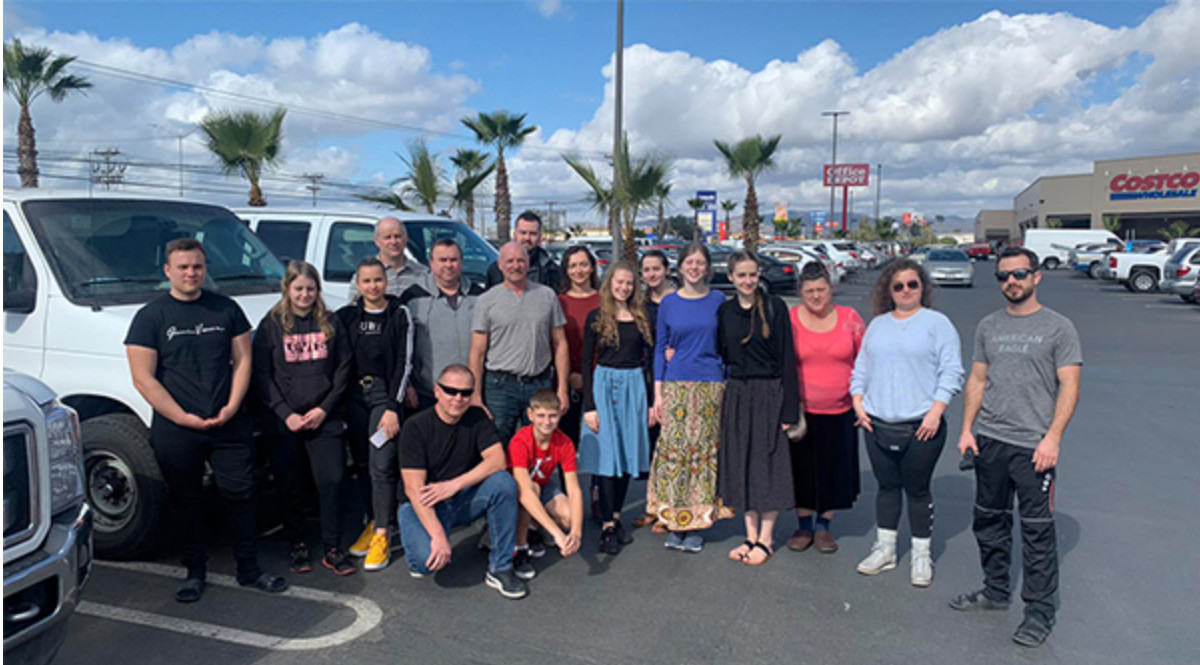
На миссии в Мексике