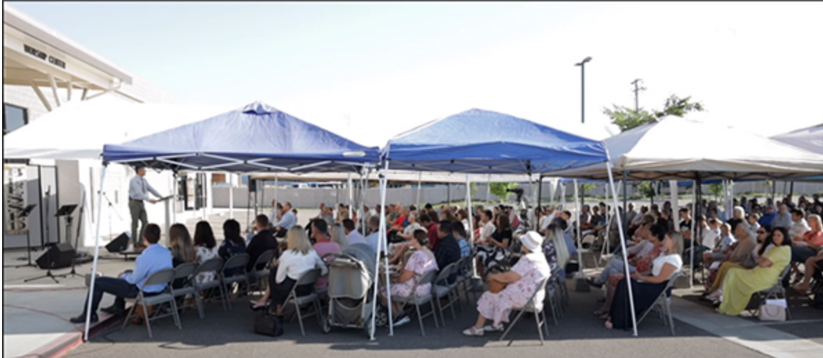
Воскресное богослужение в Grace Family Church