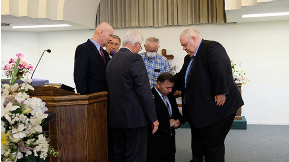
Молитва благословения нового старшего пастора церкви