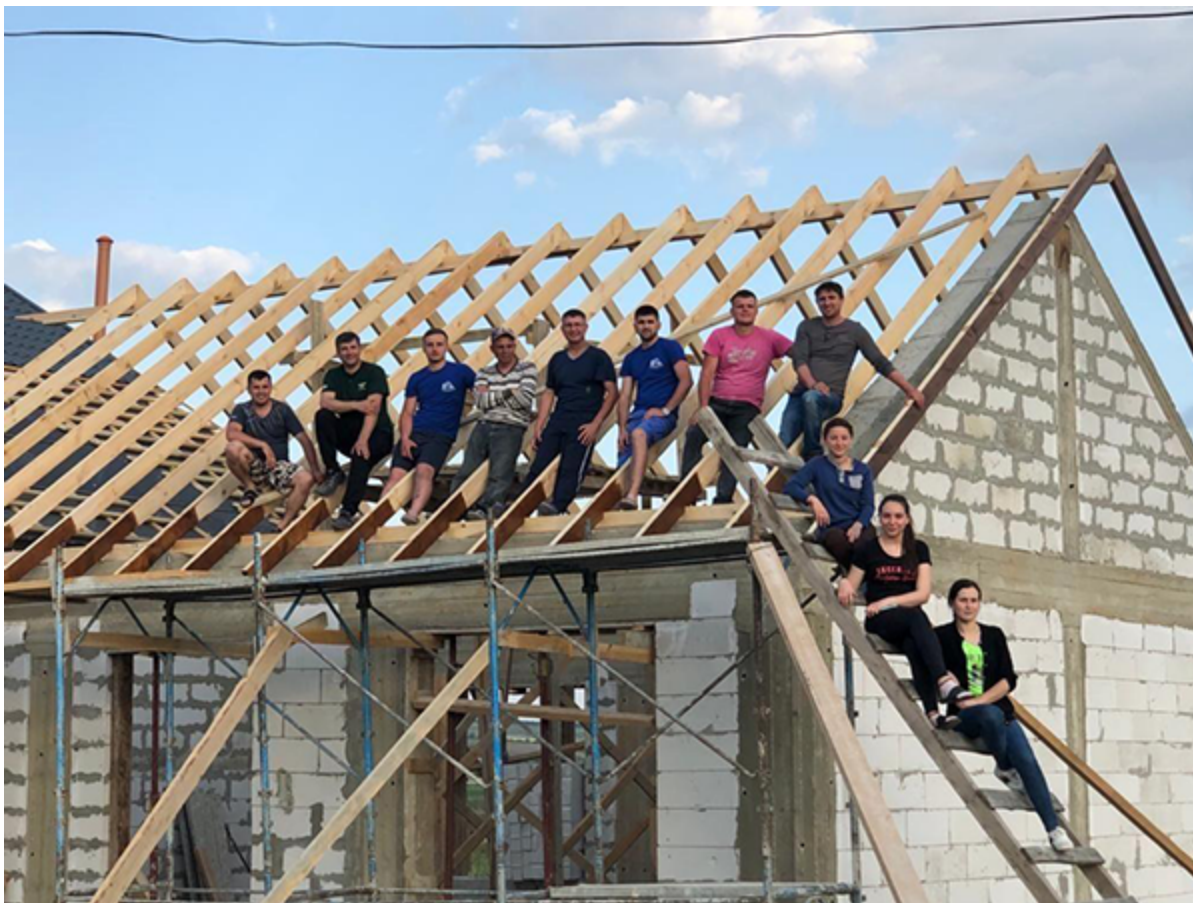
Бозиени, Молдова. Братья и сестры вместе строят молитвенный дом