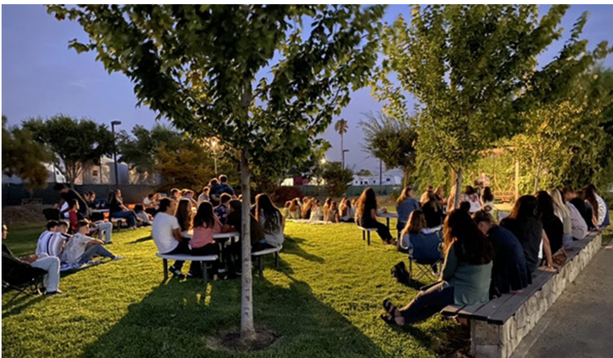
Общение на природе