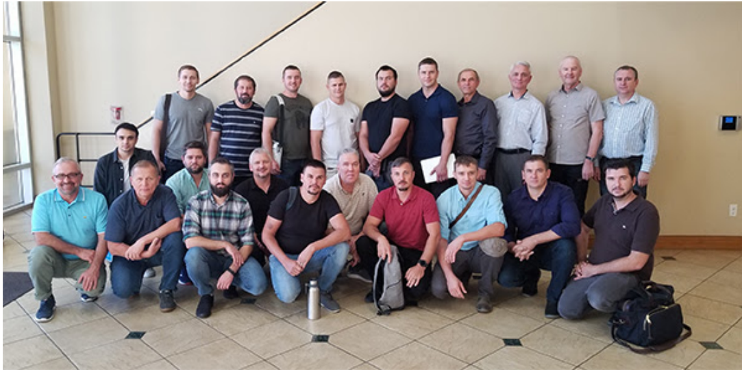
Класс в церкви Брайта

Похоже, пандемия мало отразилась на служении этого отдела. Занятия продолжают, и преподаватели уже начали приезжать даже из далекой Беларуси. Более подробно о служении читайте в статье на вебсайте Объединения – кликните эту ссылку.