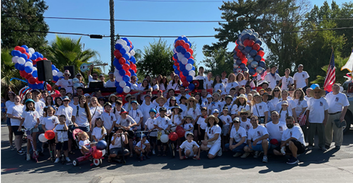
Участники евангелизации во время парада