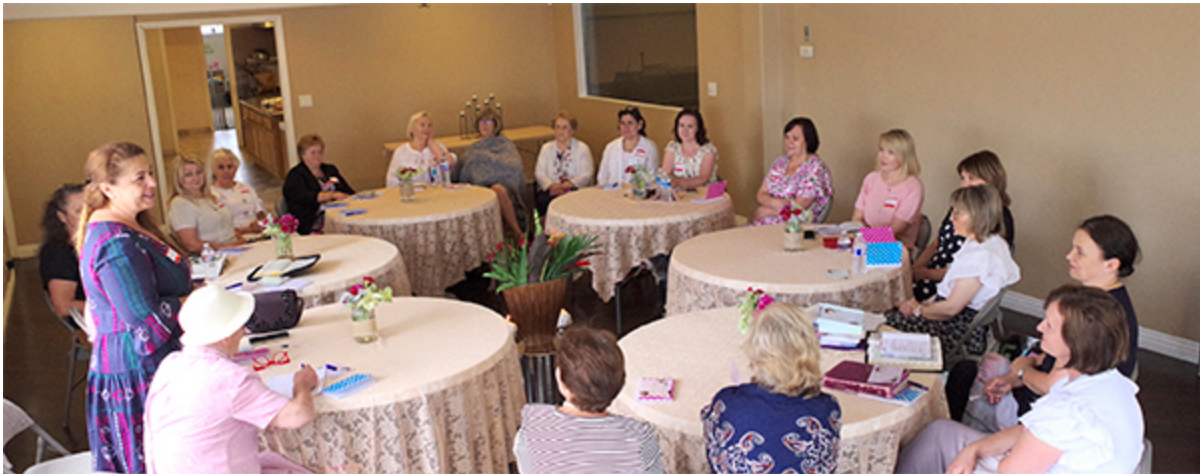
Встреча участников женского служения церквей южного региона

Десятого июля в помещении Славянской баптистской церкви Монтебелло состоялась встреча служителей Южного региона. Одновременно там прошла и встреча участников женского служения этих же церквей. Более подробно читайте в заметке И. Милеева, опубликованной на вебсайте Объединения – кликните эту ссылку .