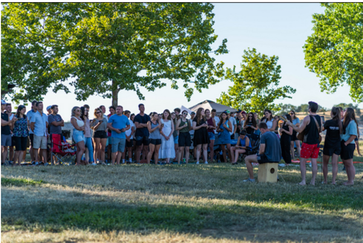
Молодежное общение на природе