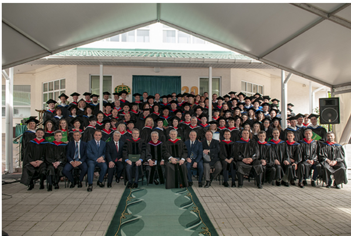
Один из выпусков семинарии в 2021 году

Украина всегда была богата христианами и своими посвященными служителями. Как только пал Советский Союз и появились новые возможности, Всеукраинский Союз ЕХБ создал свою семинарию, в которой тысячи людей на протяжении 30 лет получали и продолжают получать богословское образование. О том, как прошло празднование юбилея, рассказывается на вебсайте семинарии – кликните эту ссылку .