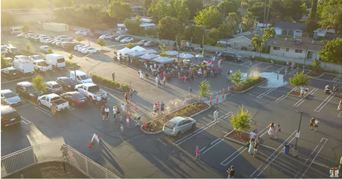
Вид на парковку церкви во время общины