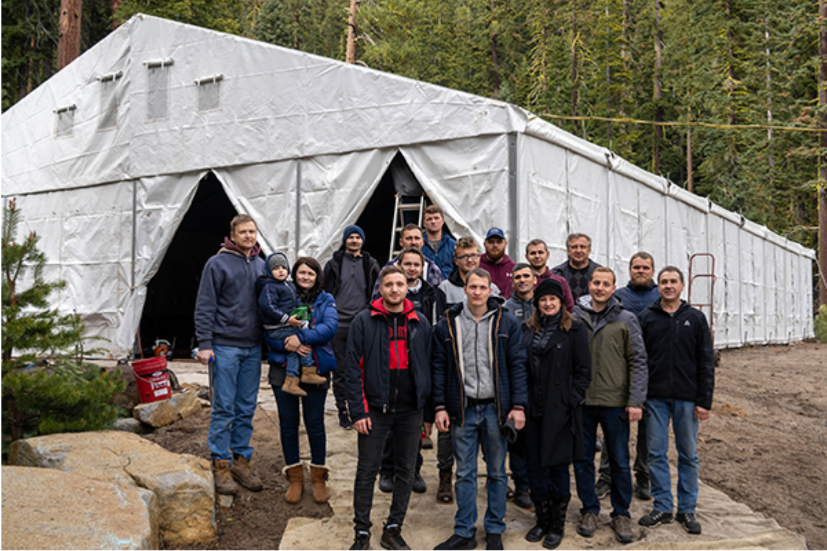
Небольшая часть команды волонтеров

замена размороженных водопроводных и канализационных систем и многое другое. В субботу, 22 мая, в лагере проводился субботник. Помочь лагерю приехало около 70 человек из сакраментовских церквей: «Вифания», «Сион», «Вторая славянская церковь». По одному человеку было и из церквей Брайта и «Первой славянской церкви». Более подробно о субботнике читайте в заметке директора лагеря П. Цвиринько – кликните здесь .