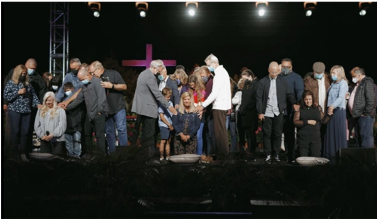
Рукоположение женщин в Saddleback Church