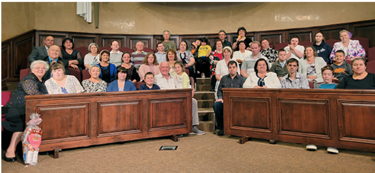
Особые мамы со своими особыми детьми и гостями праздника