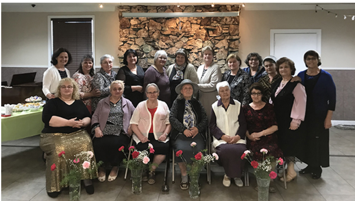
Участницы молитвенного завтрака