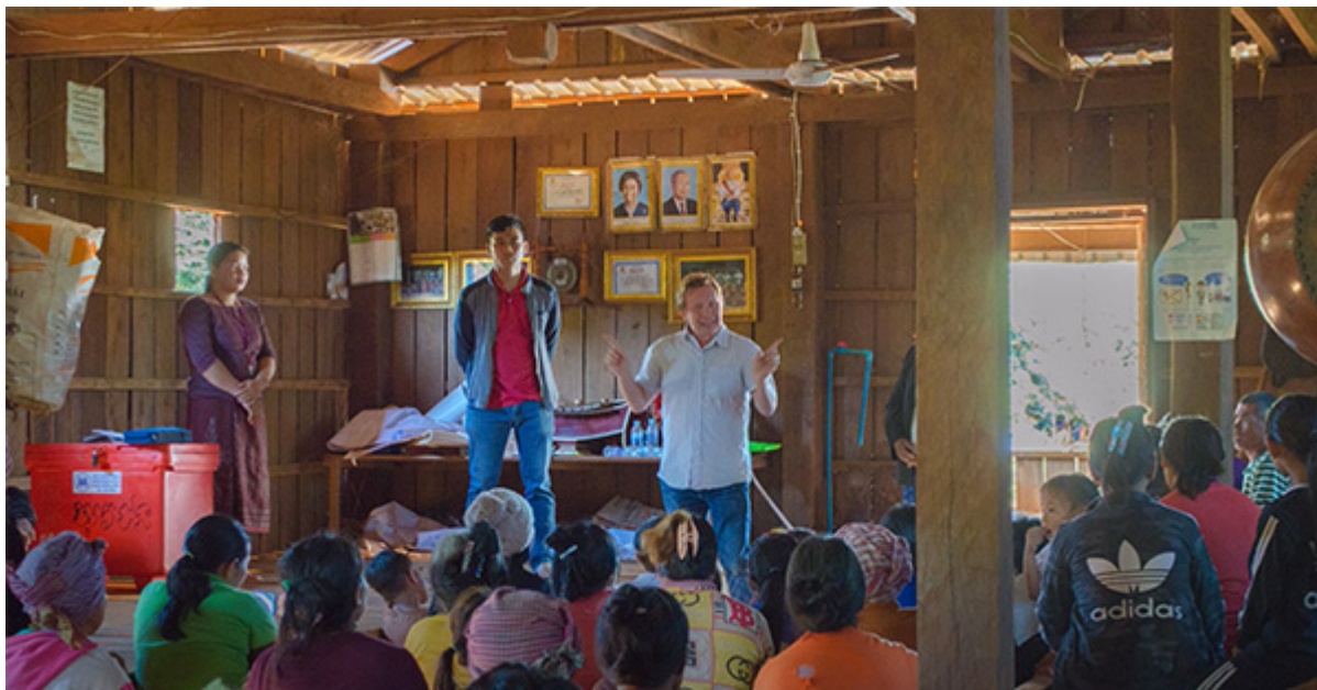
Проповедь в одном из сел