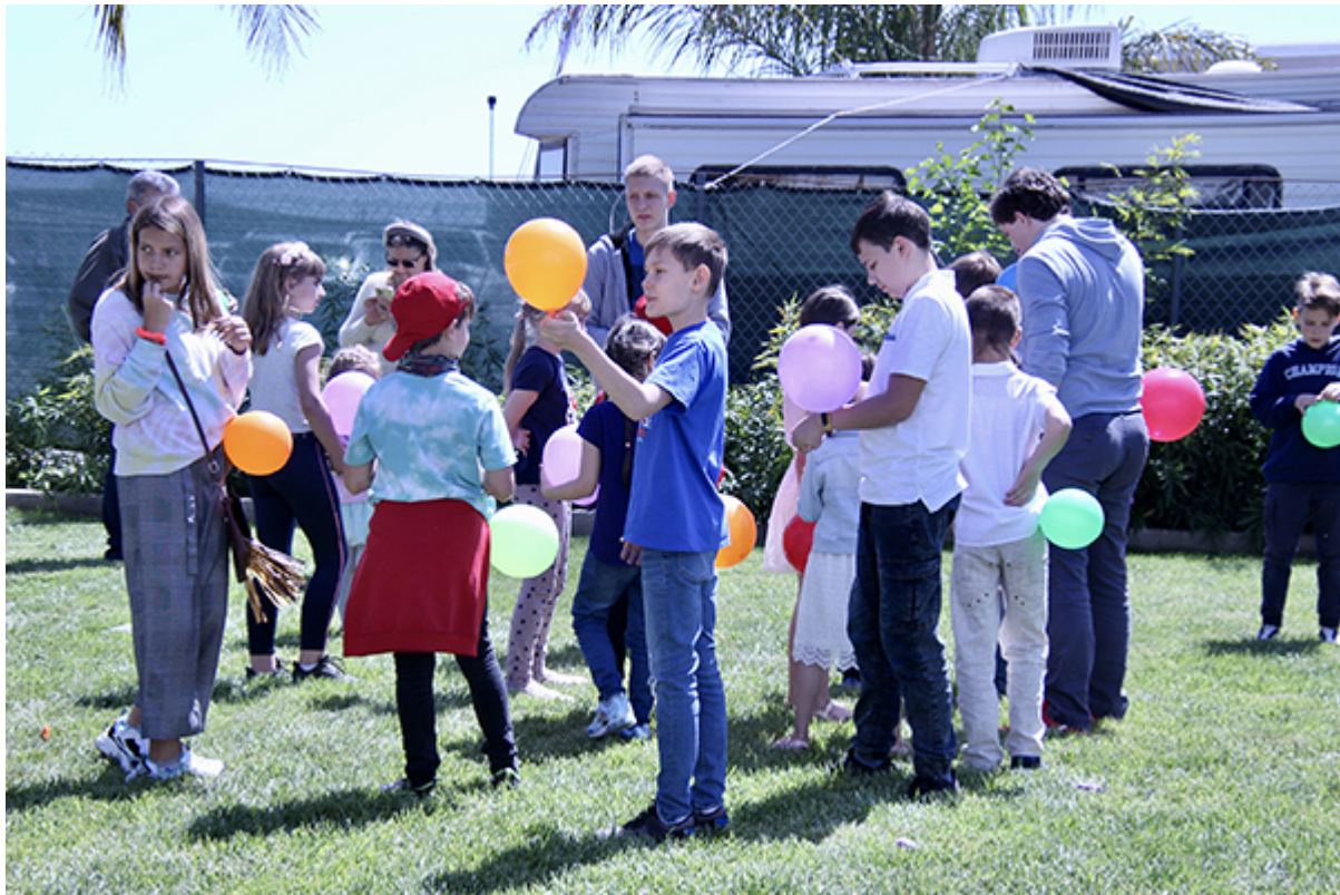
У детей были свои развлечения на празднике