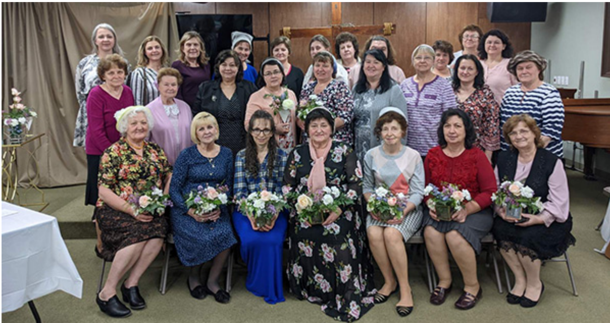
Участницы молитвенного завтрака