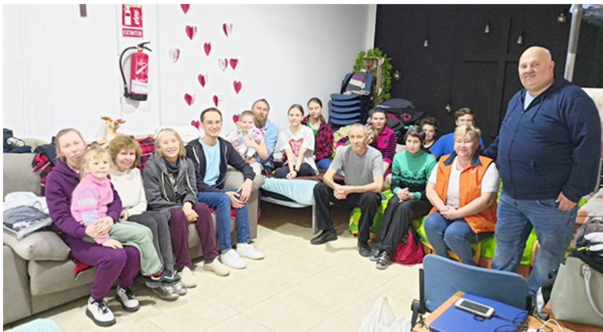
Один из моментов жизни церкви «Свет Жизни»