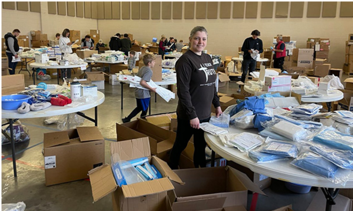
Сортировка и упаковка медицинских вещей для беженцев Украины