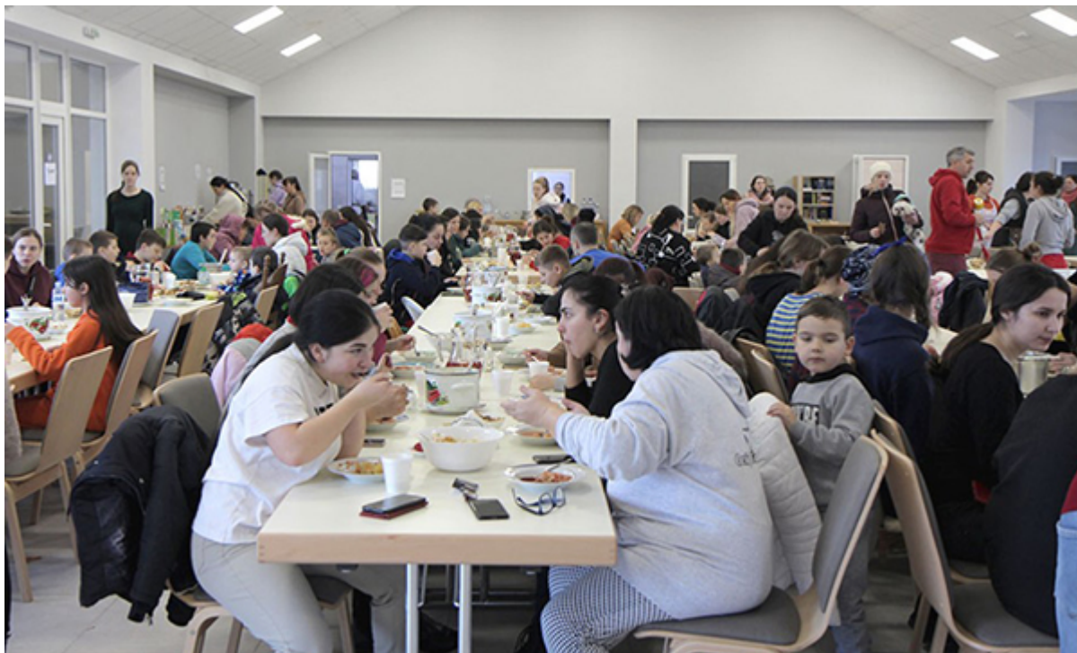
Столовая Духовного центра, где три раза в день людей кормят горячей пищей