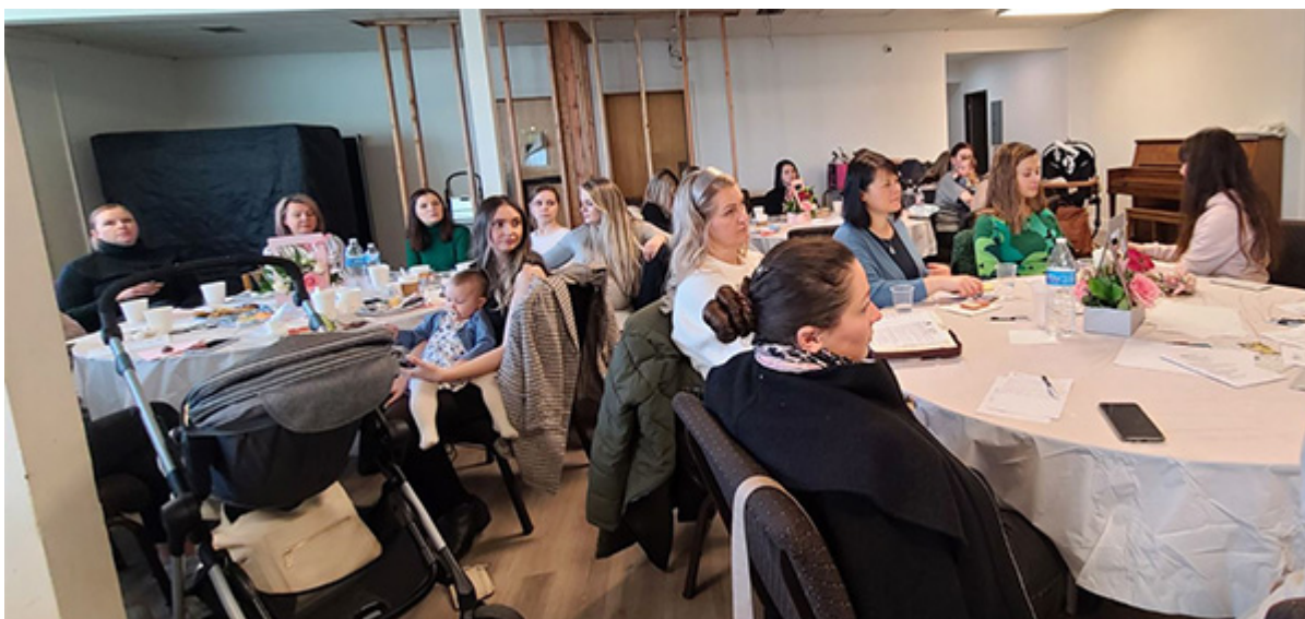
Во время семинара