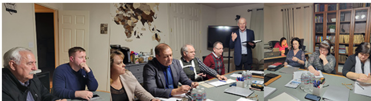
Часть из присутствующих на встрече лидеров отделов

Первая в этом году встреча лидеров отделов прошла 18 февраля в офисе Объединения. Соскучившиеся по личному общению, руководители служений рассказывали о том, что было ими сделано в течение декабря, января и февраля, о проблемах, связанных с пандемией, о планах на будущее, делились своими молитвенными нуждами как по служению, так и семейными. В заключительной молитве все эти просьбы были принесены к престолу Божьему.