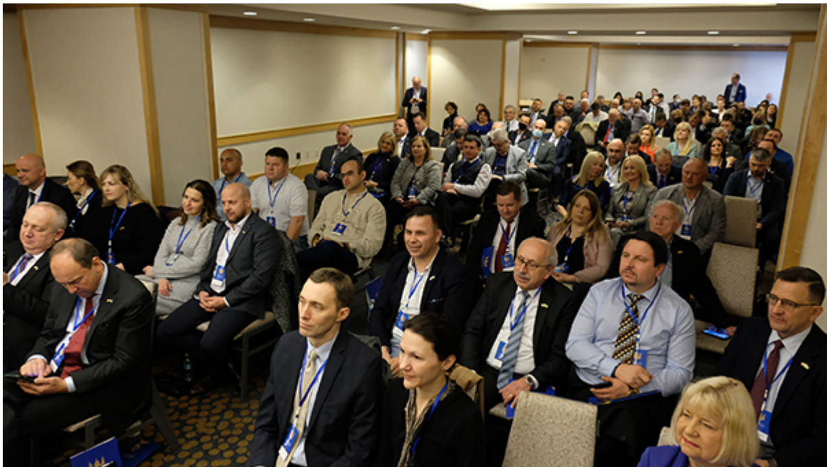
Участники молитвенной встречи