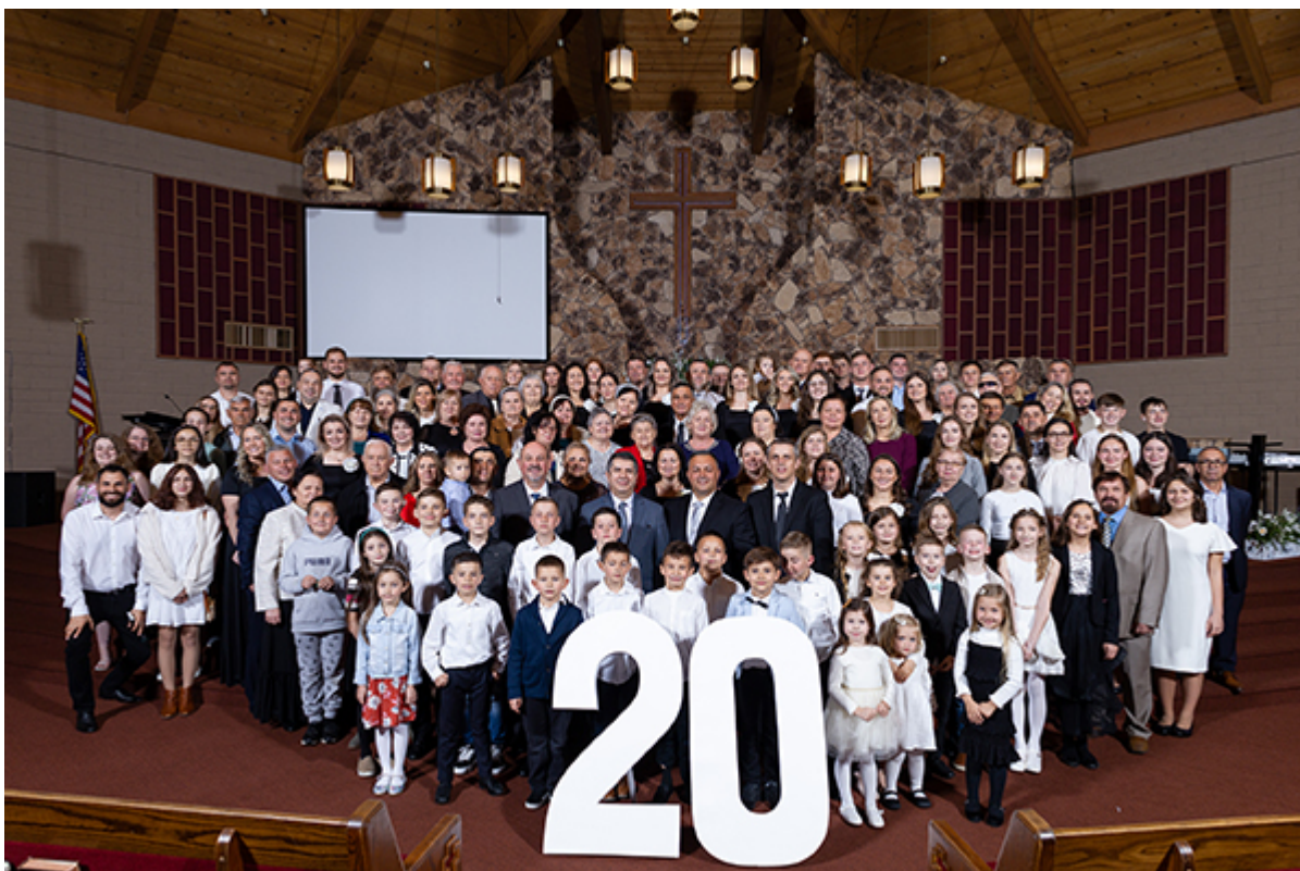
Церковь «Новая Надежда»