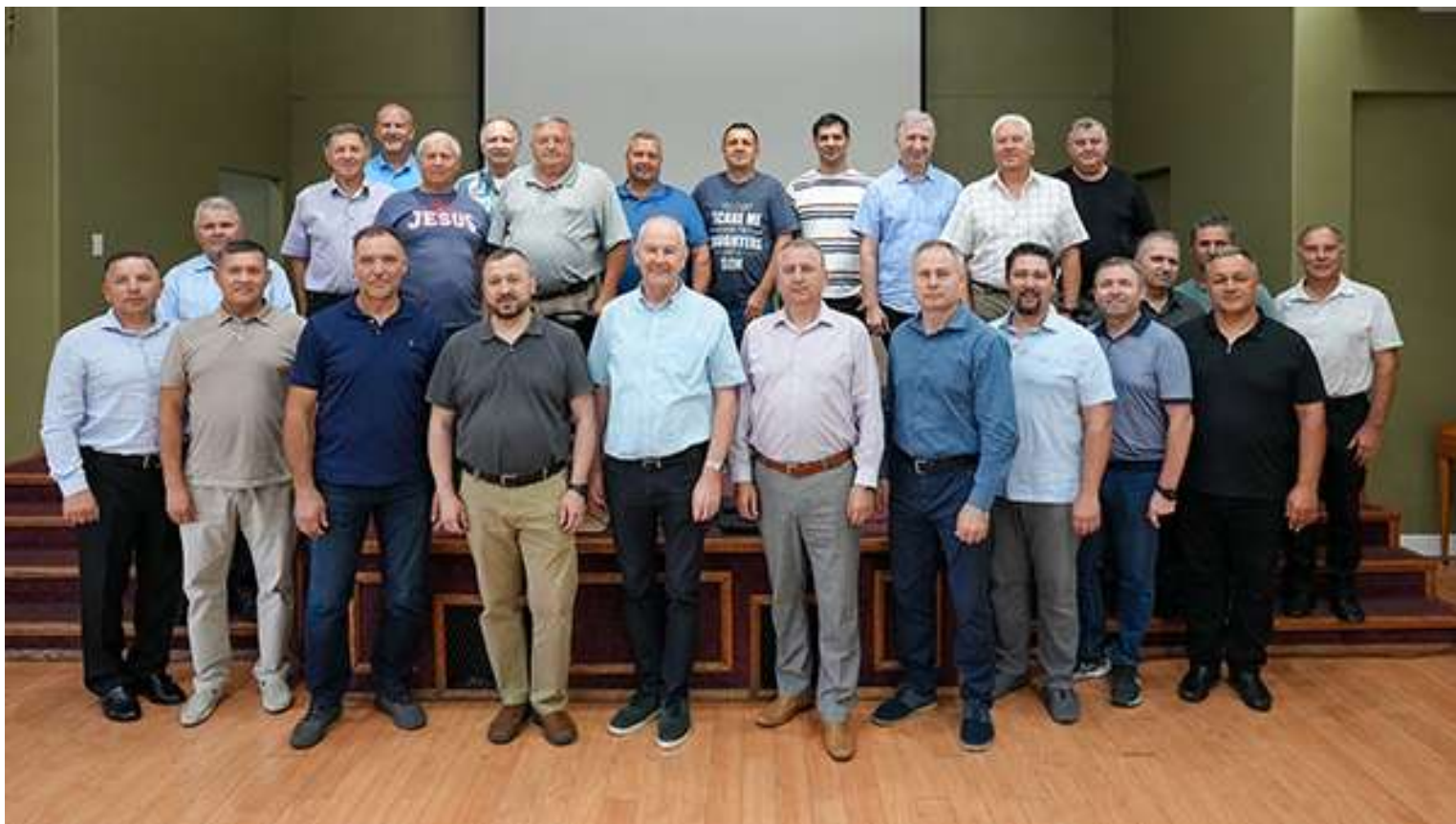
Общая фотография, сделанная во второй день встречи